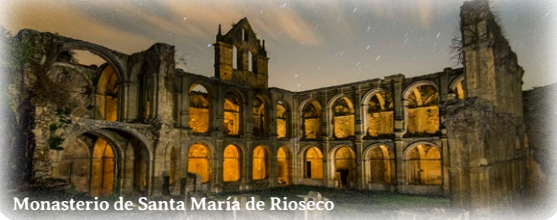
Monasterio de Santa María de Rioseco